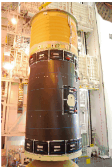
第1段・第2段起立 (H22.7.25 完了)