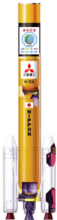
機能点検 (H22.8.16 完了)