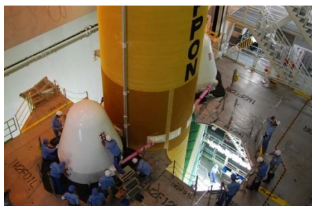
SRB-A結合 (H22.7.30 完了)