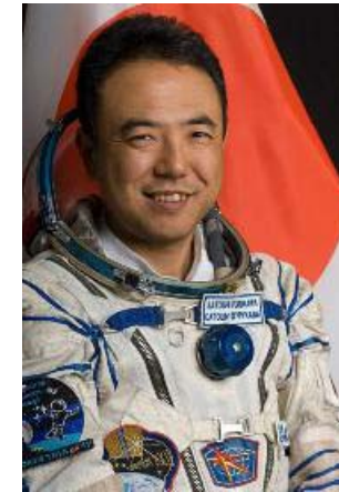
古川 聡 宇宙飛行士 (ISS第28/29次長期滞在)