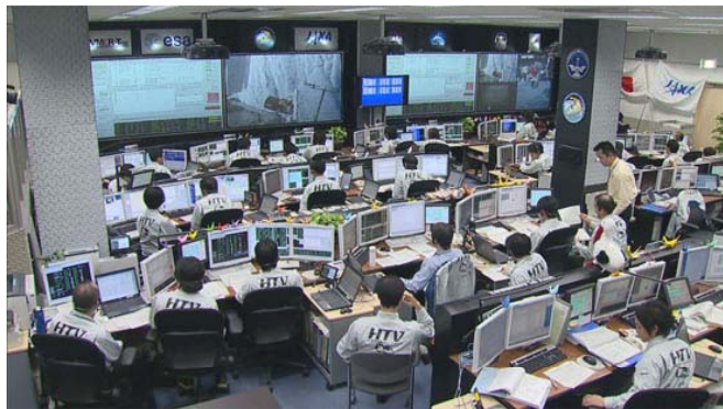
筑波のHTV運用管制室