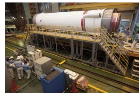
第1段機体の各種点検の様子