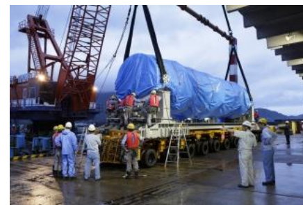
第1段の内之浦港到着