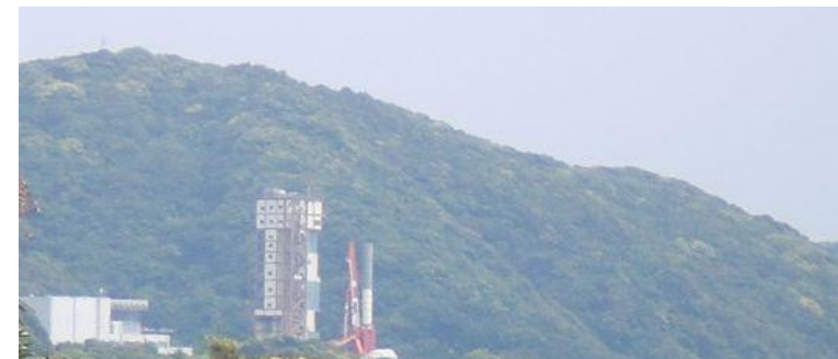
ランチャ旋回試験