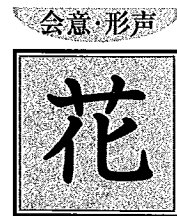
圖 7 訓 かい